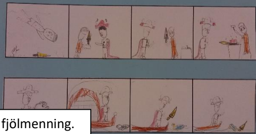
Teikning, sögugerð, tjáning, fjölmening.